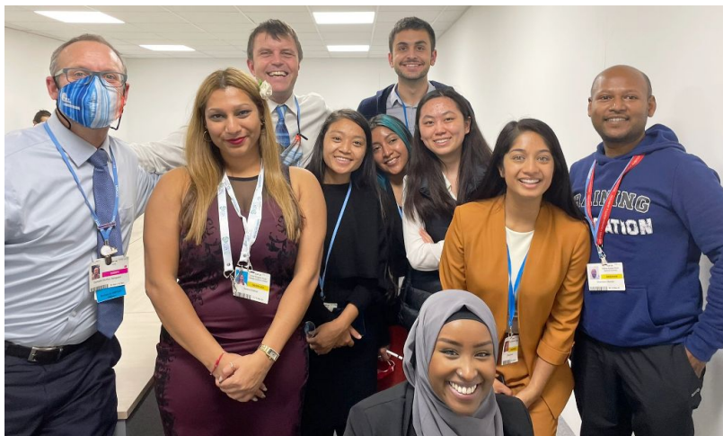
Shantanu y representantes de la juventud se reúnen con campeones de alto nivel en la COP