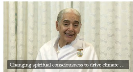
Changing spiritual consciousness to drive climate ...