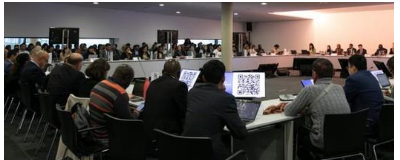
Diálogos de expertos y consultas informales

Se abordaron diversos temas y aspectos en las negociaciones en las plenarios, grupos de trabajo, reuniones informales, talleres, eventos obligatorios y muchos eventos paralelos. Algunos de los temas seguidos por varios miembros de la delegación de BK incluyeron: brechas y prioridades de género; Pérdida y daño; Sistemas alimentarios, Jóvenes y niños; transparencia, adaptación y resiliencia.