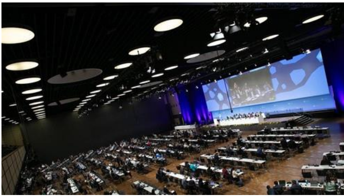
Los delegados se reúnen en plenaria para el primer día de la SB 60

La 60ª sesiones del Órgano Subsidiario de Asesoramiento Científico y Tecnológico y el Órgano Subsidiario de Implementación (SB 60) de la Convención Marco de las Naciones Unidas sobre el Cambio Climático (CMNUCC)