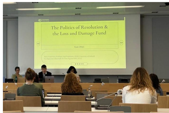
Encuentro con investigadores jóvenes