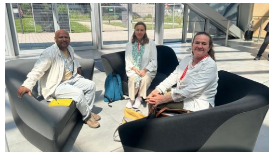
Sesión de trabajo en el corredor

Las negociaciones resaltaron la necesidad urgente de mejorar las estrategias de adaptación y resiliencia climática, enfatizando el apoyo financiero y el desarrollo de capacidades para las naciones vulnerables. Según nuestras observaciones, el elemento que falta es desarrollar resiliencia interna, creando una oportunidad significativa y la necesidad de un compromiso más profundo de BK.