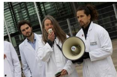
Miembros del movimiento Rebelión Científica afuera del lugar el primer día del SB 60