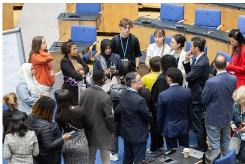
Los participantes trabajan en grupos de trabajo para discutir cómo empoderar a los niños para que se conviertan en agentes de cambio.