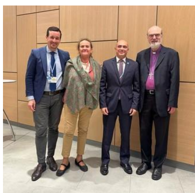
Valeriane con colegas de interfe