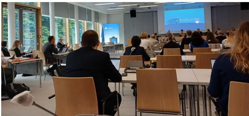
Reunión con Jim Skae, copresidente del Panel Intergubernamental sobre Cambio Climático (IPCC)

Todos los días, los miembros de Brahma Kumaris estuvieron presentes en las reuniones de coordinación de RINGO - Organizaciones no gubernamentales independientes y de investigación, donde se compartió información actualizada sobre las negociaciones y se detalló información sobre grupos temáticos seleccionados.