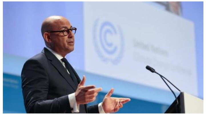
Secretario ejecutivo de la CMNUCC Simon Stiell

La reunión SB60 de la ONU sobre Cambio Climático (CMNUCC), celebrada en junio de 2024, fue una sesión de los Órganos Subsidiarios que se centra en el trabajo técnico y preparatorio para la acción climática. A diferencia de las reuniones más grandes de la COP (Conferencia de las Partes), que toman decisiones y compromisos importantes, el SB60 se centra en negociaciones detalladas y discusiones técnicas para respaldar esas decisiones.