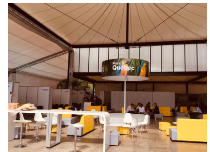
Plaza Quebec, donde se encuentra el Pabellón de la Fe