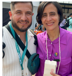
Con Susana Muhamad, Presidenta de la COP16 y Ministra de Ambiente de Colombia