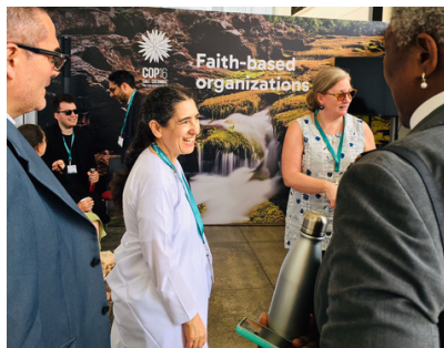
En el Pabellón de la Fe